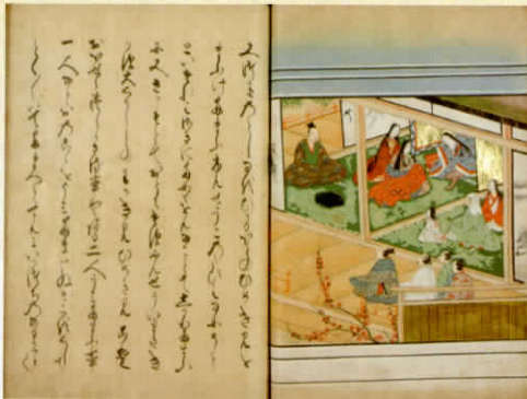
文正夫婦と娘たち

近年、積極的に育児を行なう男性、いわゆる「イクメン」が増えつつあります。しかしながら、男性が育児に関わるという環境が様々な面で十分に整っているとは言えないのが現状ではないでしょうか。では、現在よりも父親が子どもを養育するという意識が弱かったとされる平安時代に、貴族男性はどのように子育てに関わっていたのでしょうか。当時の貴族が書き記した日記や物語などの史料から、平安時代の子育てをする父親の姿を紹介していきます。