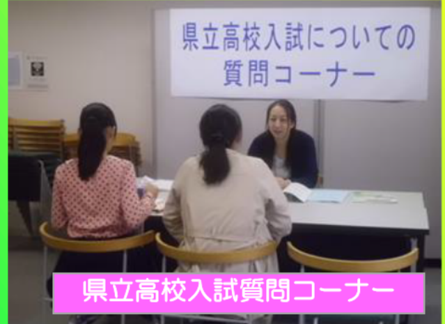
県立高校入試質問コーナー