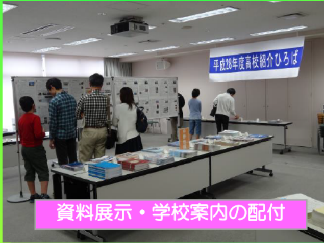
資料展示・学校案内の配付