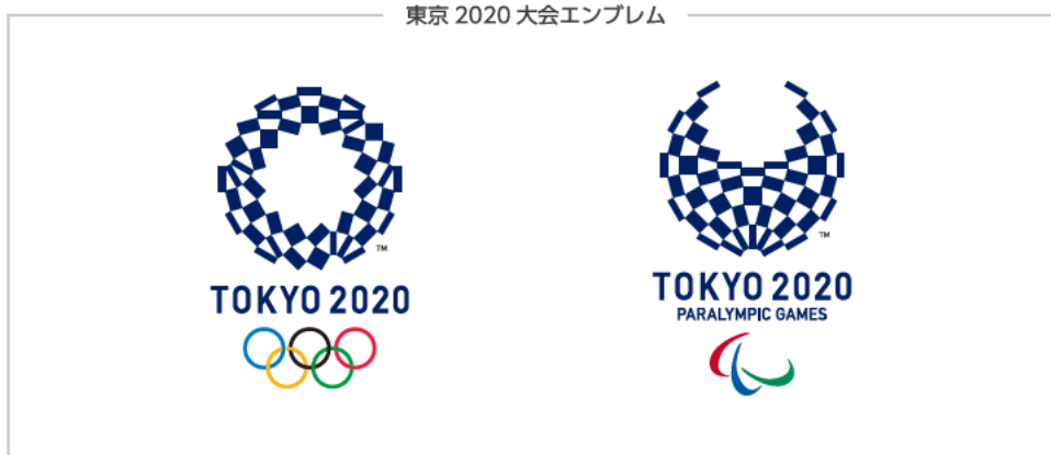
東京 2020 大会エンブレム

ライセンシングプログラムより得られる収益は、東京 2020 大会の準備・運営費、並びに、オリンピック及びパラリンピック日本代表選手の育成・強化事業等に活用されます。