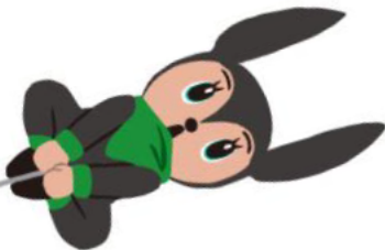
三重県応援キャラクター