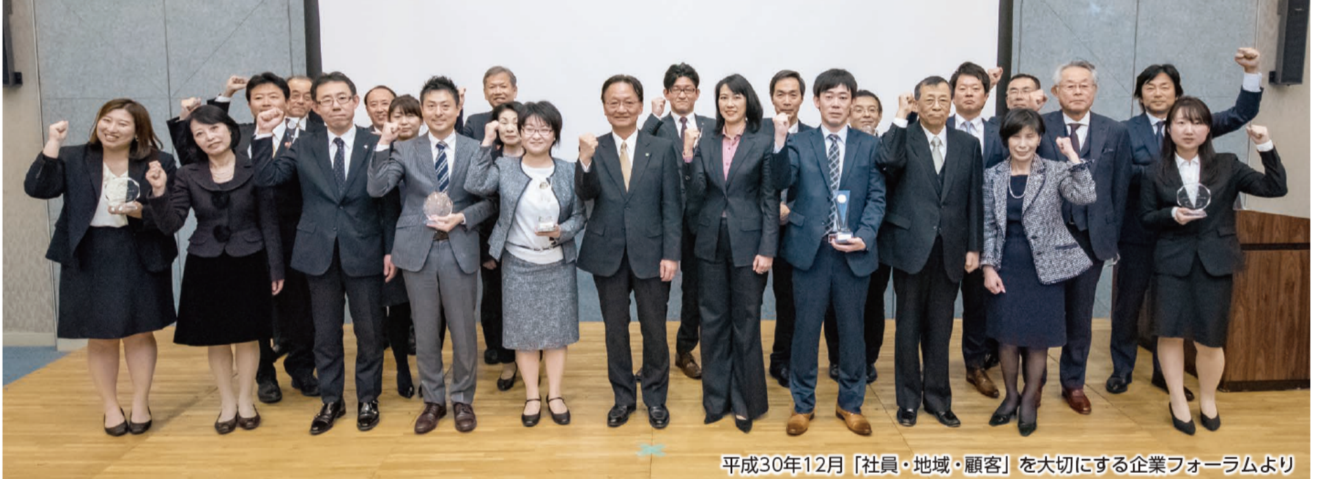
平成30年12月「社員・地域・顧客」を大切にする企業フォーラムより