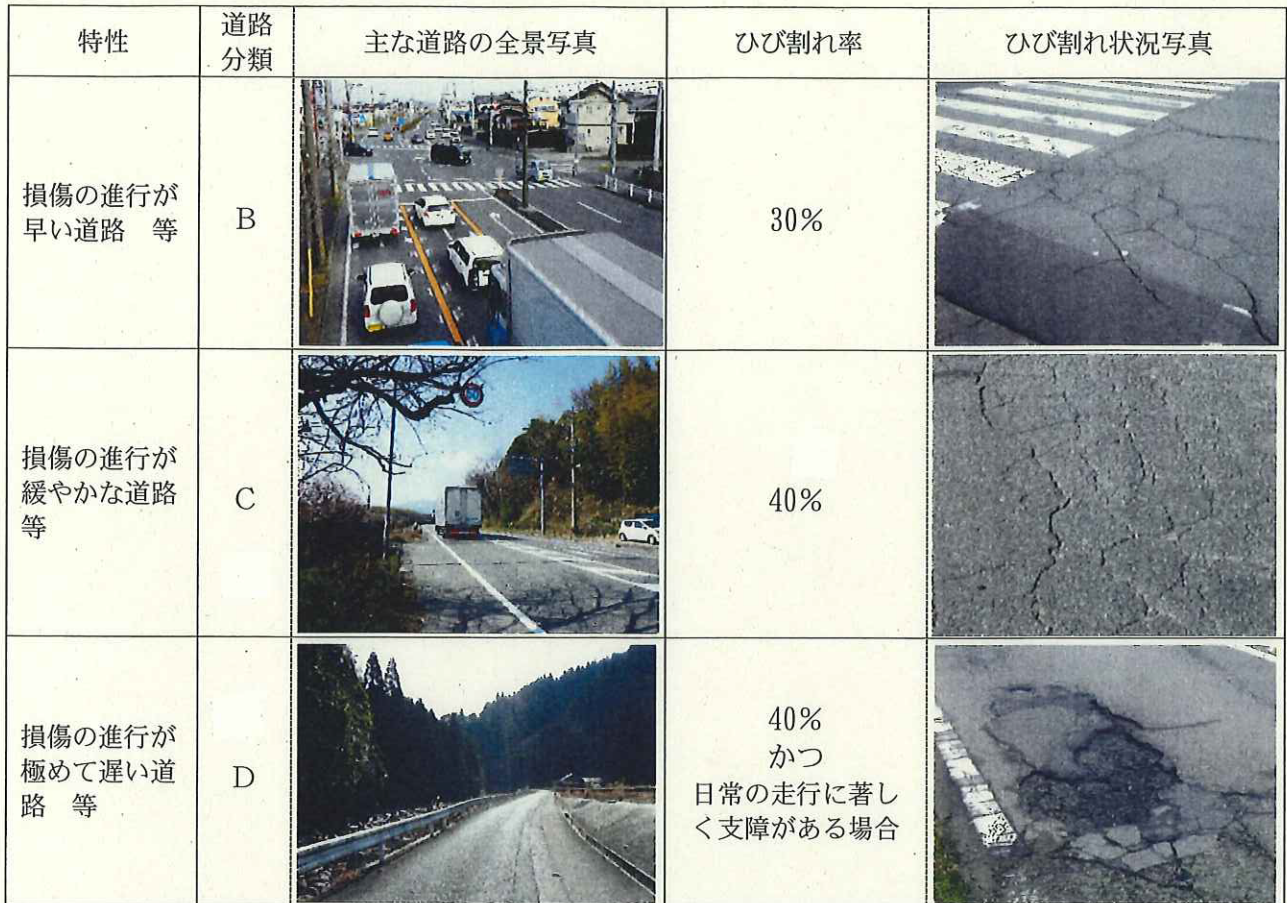
〔表2〕 主な道路の全景写真、ひび割れ状況写真