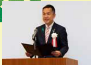
知事による開講宣言

森林、林業、木材産業または地域社会等において、さまざまな課題に自ら取り組み、それぞれの分野をけん引していく人材を育成する学校です。 新たな視点や多様な経営感覚、幅広い知識や高度な技術を養い、森林、林業、木材産業をさらに発展させ、持続可能な森林資源の活用促進をめざします。