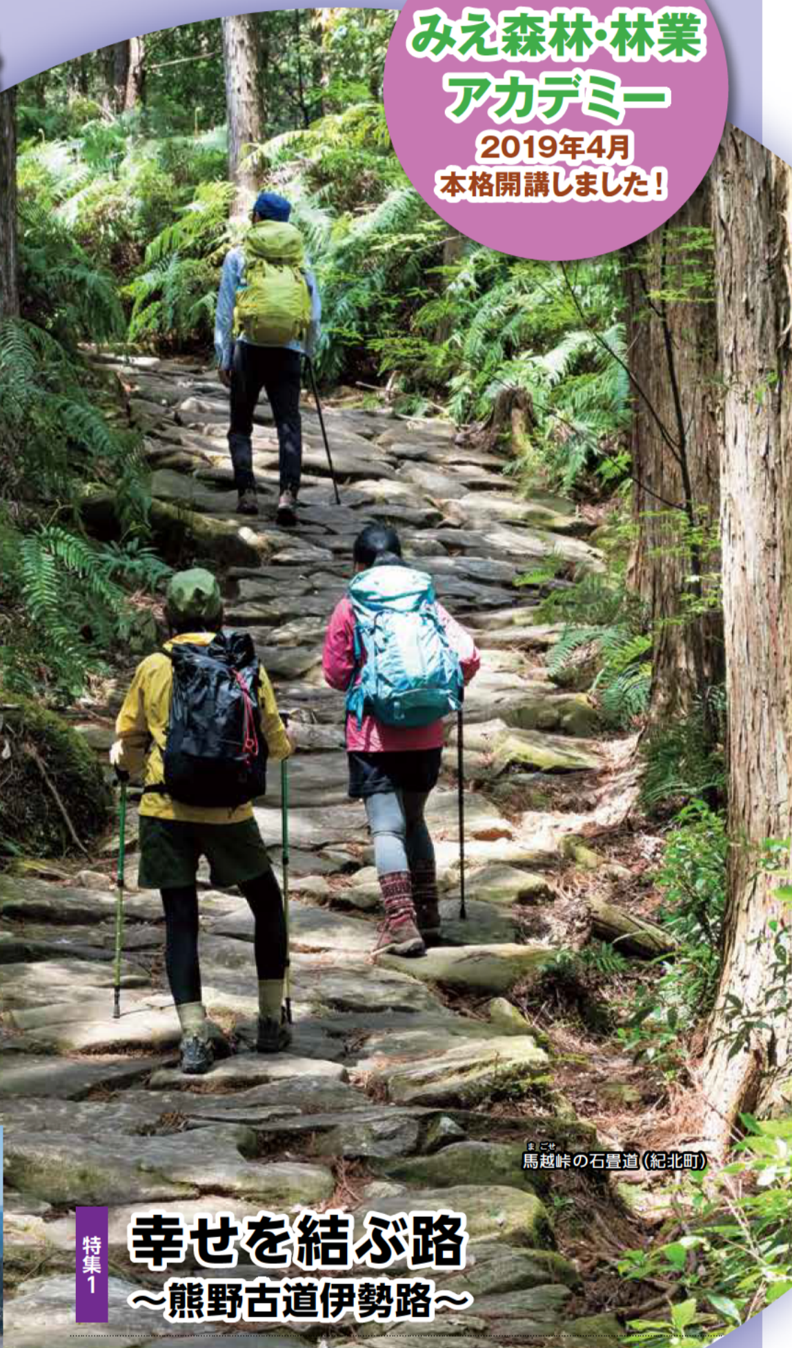
馬越峠の石畳道 (紀北町)