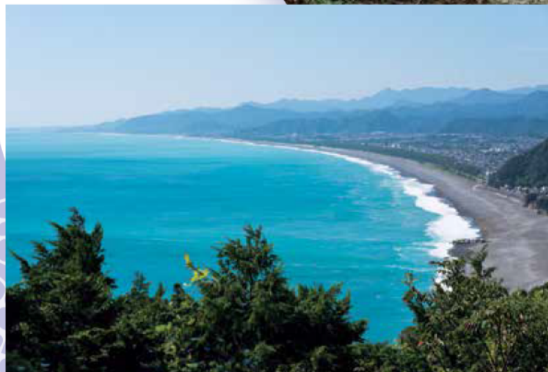
松本峠から望む七里御浜 (熊野市)