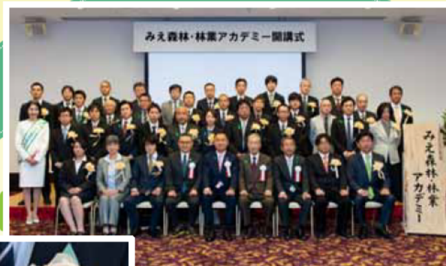
開講式で入校者の胸を飾った尾鷲ヒノキのコサージュ

現在は、津市白山町にある県林業研究所内で、月1~3回程度の集中講義形式で、知識・技術を磨いています。