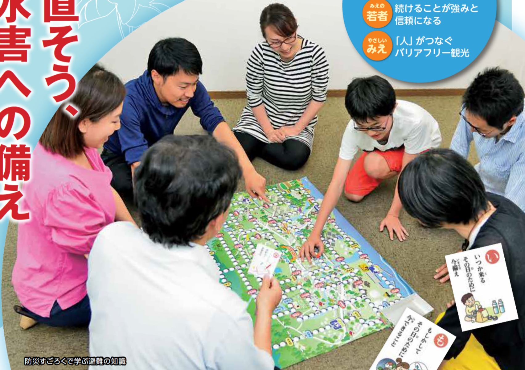
防災すごろくで学ぶ避難の知識

今年も、伊勢湾台風襲来から60年の節目の年です。集中豪雨や大型台風が毎年発生し、異常気象が当たり前のようになってきた今、改めて「風水害への備え」について考えてみませんか。