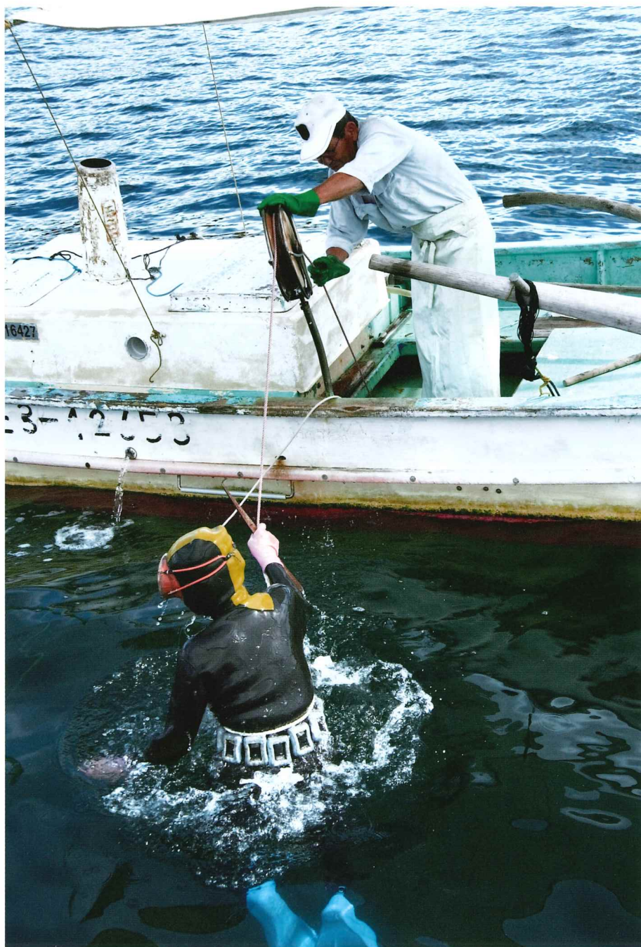
鳥羽・志摩の沿岸部では、この時期、夏のアワビ漁が本番を迎えます