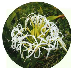
海辺に咲くハマユウ