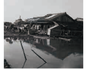
伊勢湾台風により浸水した民家