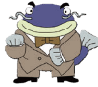
三重県防災啓発キャラクター「なまず博士」