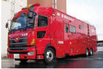
四日市市消防本部 支援車I型