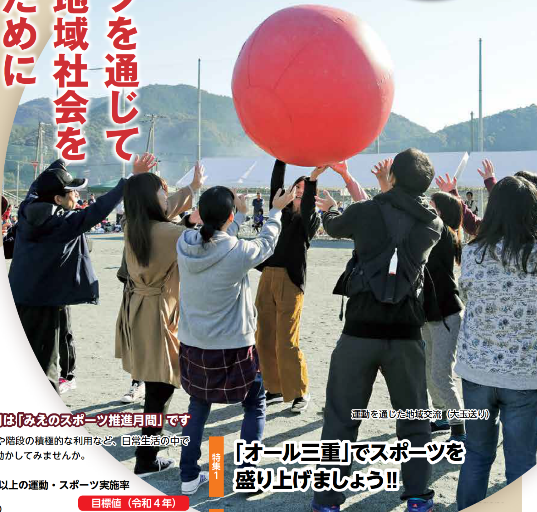
運動を通じた地域交流 (大玉送り)

県では、スポーツの持つ価値を最大限に活用し、スポーツを通じた人づくりや地域づくりを進めています。今号では、地域スポーツの推進について紹介します。