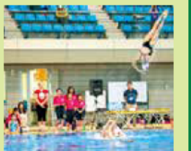
(キャンプ地決定状況(令和元年7月現在))

本県では、東京2020オリンピック・パラリンピックの各国代表チームの事前キャンプ地誘致を進めており、事前キャンプをきっかけとした住民の皆さんとの交流促進に取り組んでいます。