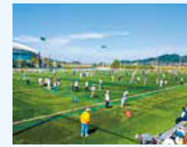
みえスポーツフェスティバル

県民の皆さんがライフステージに応じて、運動・スポーツを通じた健康づくりを進め、さらには健康寿命の延伸につながるよう、情報発信やイベント開催の取り組みを進めます。