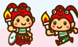
三重とこわか国体・三重とこわか大会 マスコットキャラクターとこまる

大規模大会の開催により、有形(スポーツインフラの整備など)、無形(スポーツに対する関心、大会運営のノウハウやおもてなし精神、競技力の向上など)のレガシーの創出が見込まれます。このレガシーを長期的な視点でのスポーツ振興や、スポーツを通じた地域活性化につなげていくための取り組みを行います。