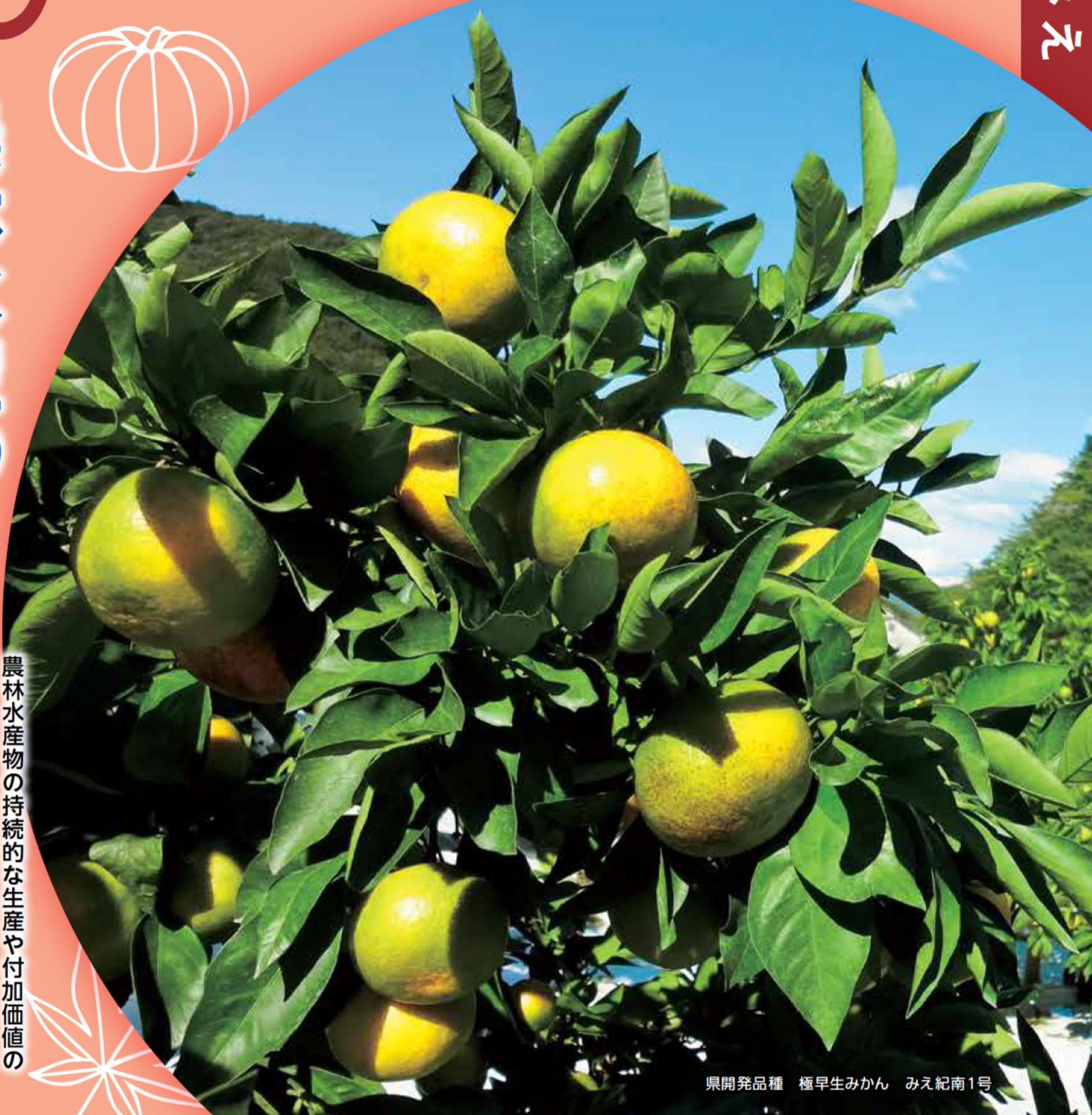
県開発品種 極早生みかん みえ紀南1号

農林水産物の持続的な生産や付加価値の向上をめざし、県内の4つの研究所において日々、調査や研究開発が行われています。今号では、各研究所の取り組みや開発した農林水産物について紹介します。