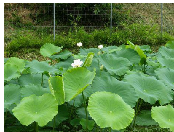
排水不良田にて取組み始めた「蓮（蓮根）」