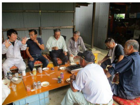
草刈り後の交流会