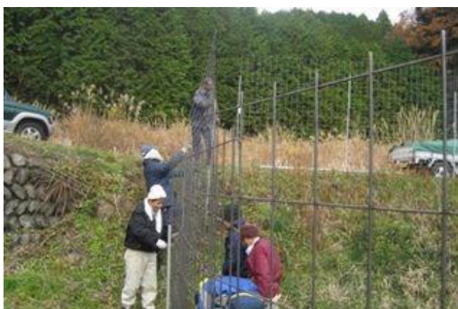
ワイヤーメッシュ柵設置作業