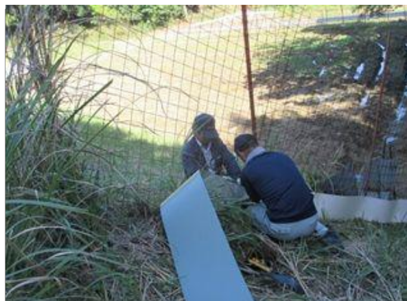
イノシシ避け目隠しの設置作業