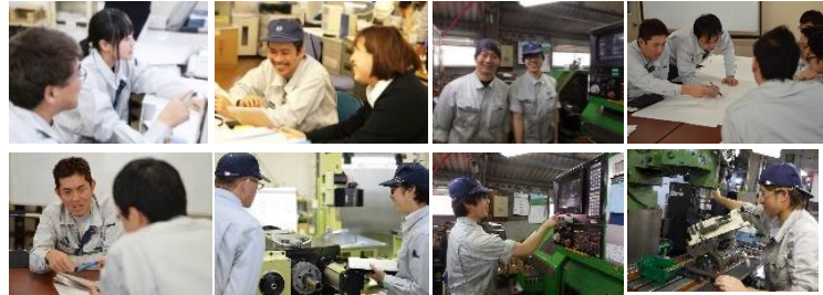
性別や年齢、国籍に関わらず多様な人材が多数活躍中！