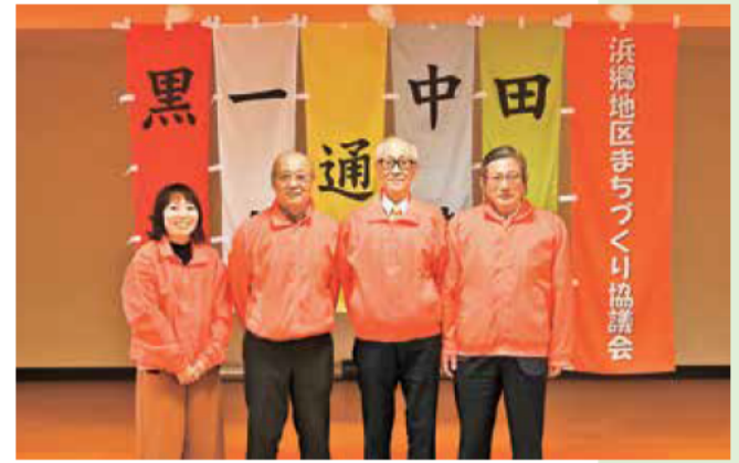
はまごうちく 濱郷地区まちづくり協議会 伊勢市 5つの自治会で「自分たちで助け合い、災害から命を守る！」を合言葉に、濱郷地区全体の防災訓練の計画・実施に取り組んでいます。2019年度「みえの防災大賞」を受賞。