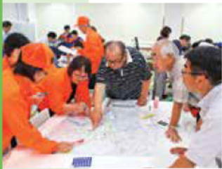
災害図上訓練では、真剣な討議が行われ、各自治会の連携強化につながりました。

川沿いに集落がある私たちの地域では、津波の危険性が高いため、防災を重点に置いた活動をしており、防災が住民にとって身近なものとなるよう工夫を凝らしています。例えば、堤防の高さや潮位・海面の高さを具体的な数値で説明し、津波の危険を認識できるようにしています。また、各自治会のリーダーを育てる訓練を行う、炊き出し訓練では毎回600～800食用意するなど、訓練は自分たちの地域の人材や状況に応じた内容にしています。