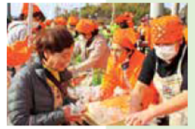
メンバーによる炊き出し訓練の様子。

出し訓練などを行い、さまざまな住民同士が関わり合う機会をつくっています。活動を続けることで、子どもや高齢者、障がいを持つ方などを含め、いろいろな立場や世代の人が一緒に共助の輪に加わる三重にしていきたいです。