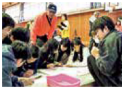
地元小学校で実施した避難所運営ゲーム(HUG)。子どもの防災力向上につながっています。

地域でいろいろな人と関わってほしいです。私たちは「防災」を共通のテーマとして活動していますが、自治会の祭でも何でも、何か共通のテーマで活動が起これば、人と人の関わり合いが生まれます。そして、その活動を活性化させることが、地域のコミュニティづくりや共助の体制づくりになり、地域全体の元気につながると思います。私たちは、そのような関係や共助をめざして、小学校での防災授業や炊き