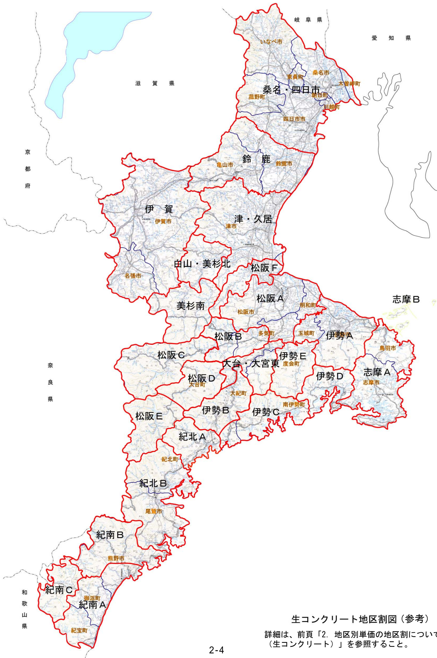
生コンクリート地区割図（参考）

詳細は、前頁「2. 地区別単価の地区割について（生コンクリート）」を参照すること。