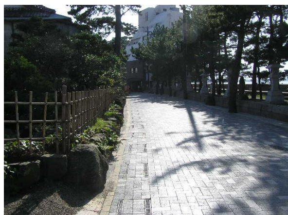
二見町茶屋地区のまちなみ