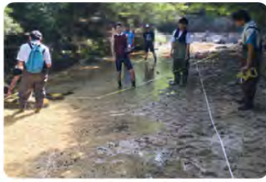
▲生息地の環境測定。物理的な環境について記録し、ネコギギの生息に好適な区画を抽出しています。

ハードな調査ですが、過去の先輩方がこの調査を継続・発展してくれてたおかげで私たちは生息地の現状を詳しく理解することができます。