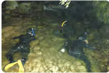
▲夜間潜水調査。川はあまり深くないので「カバ」のように少し浮きながら水底を蹴ったり、「トカゲ」のように這いつくばったりして進みます。

2004年から始めたネコギギのモニタリング合宿は、毎年夏休みに4泊5日を実施しており、卒業生も参加して調査に協力しています。ネコギギは夜行性の魚なので、日中に生息地の水深や底質などの物理的な環境について調べ、夜はネコギギの生息数を把握するための夜間潜水調査を行います。