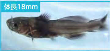
▲ 成魚と同じような体側のまだら模様がよくわかるように。