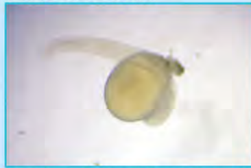
▲ 孵化したばかりの稚魚は体長4mmほどでとても小さく、まだ泳げません。