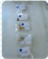
▲おなかのなかにあったもの