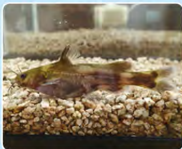
▲産卵前のネコギギの雌。

▶孵化率は非常に低く、この段階で生き残る数は少なくなっています。卵の直径は約1.5mmほどで、産卵後3日くらいで孵化します。