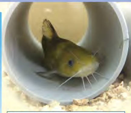
「ネコギギ」(ナマズ目ギギ科) 成魚の体長は雄で約10cm。4対のひげがあって、体は茶色で黄色がかった模様があります。丸い頭に、大きくてかわいらしい眼をしています。