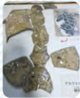
▲鱗板(うろこがくっついたもの)