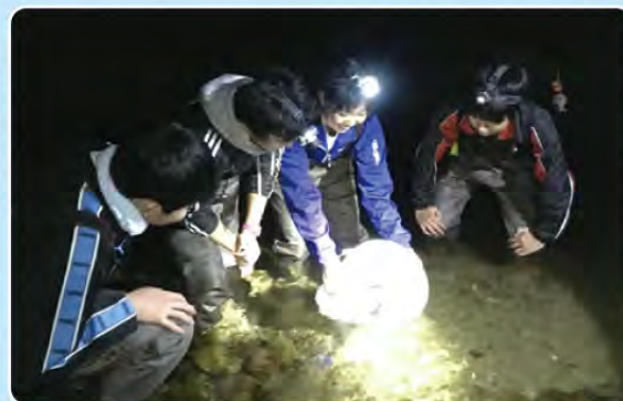
※日本魚類学会の放流ガイドラインに則り放流します。

▶ 学校で誕生し放流したネコギギに調査で再会するという嬉しい機会もありました。久しぶりの再会に「元気に育ってくれて良かった」とネコギギの親になったような気持ちになるそうです。