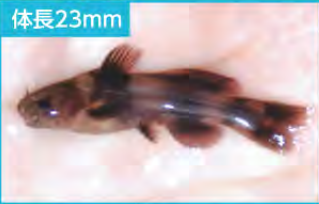
▲ 成魚とよく似た形態になりました。