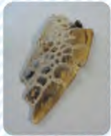
▲アカウミガメの前足