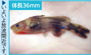
▲ いよいよ放流間近です。