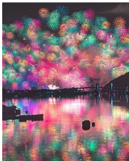
きほく燈籠祭(紀北町) ▲ jan69tys 様