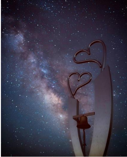
ハートの入江・見江島展望台(南伊勢町) ▲ yuji9607 様