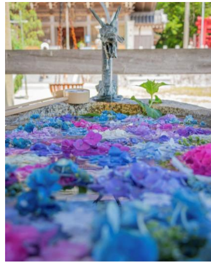
金井神社(いなべ市) ▲ yyh_k17 様