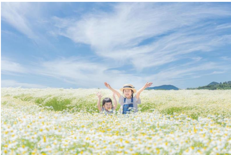
メナード青山リゾート(伊賀市) ▲ side_colorful 様