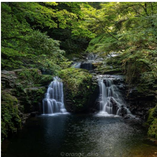
赤目四十八滝(名張市) ▲ orange_akio 様