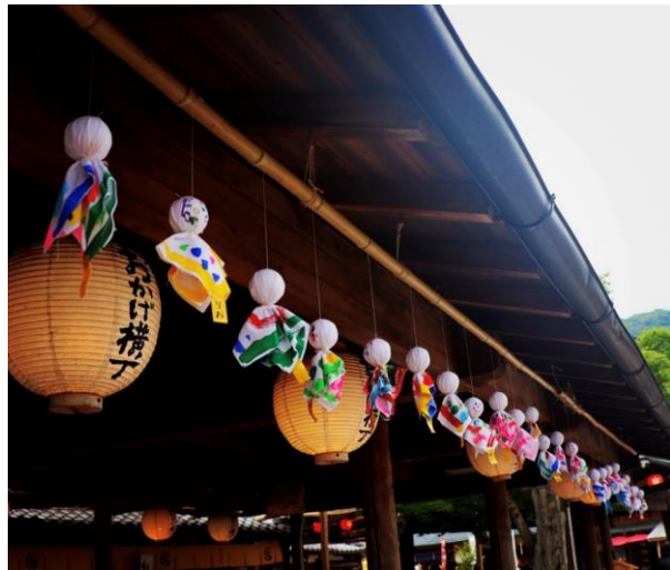
おかげ横丁(伊勢市) ▲ tsubo_shu1 様