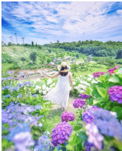
かざはやの里(津市) ▲ kosa_photo 様