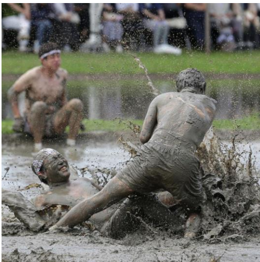
伊雑宮御田植祭(志摩市) ▲ kanasand_o 様