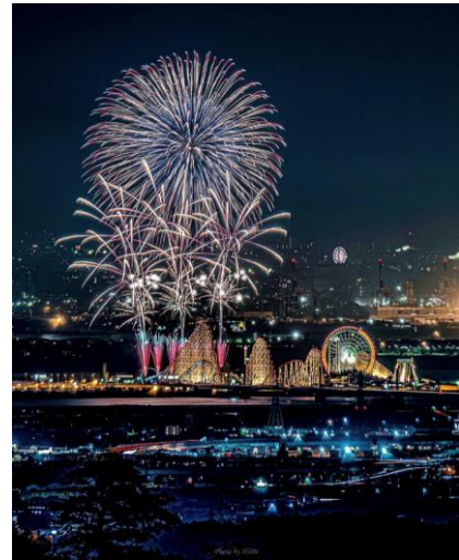
ナガシマリゾート(桑名市)