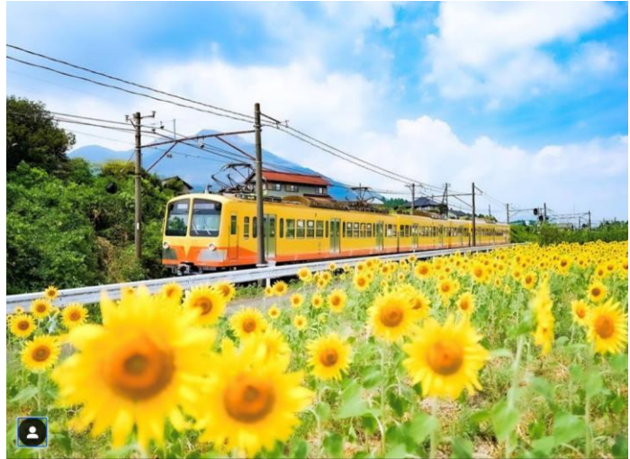
三岐鉄道(いなべ市)