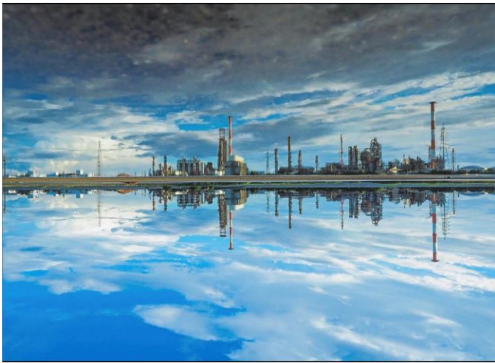
四日市コンビナート(四日市市) ▲ sen.1000sin 様