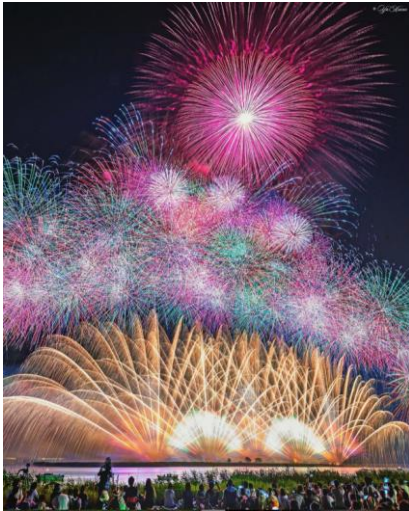
桑名水郷花火大会(桑名市)