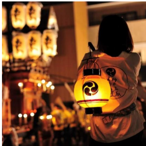
神戸石取祭(鈴鹿市) ▲ hideo_tanase 様