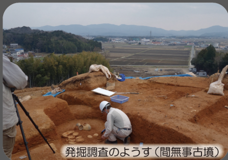
発掘調査のようす(間無事古墳)