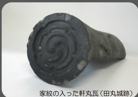
家紋の入った軒丸瓦(田丸城跡)