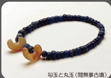
勾玉と丸玉(間無事古墳)