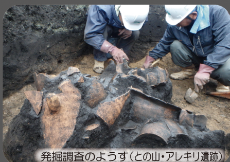
発掘調査のようす(との山・アレキリ遺跡)