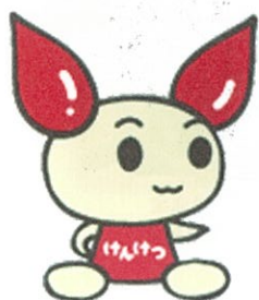
献血推進キャラクター 「けんけつちゃん」