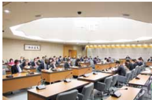
議会改革推進会議総会（11月13日）の様子

令和2年8月19日の議会改革推進会議役員会において「新型コロナウイルス感染症に関する対応マニュアル検討プロジェクト会議」が設置され、6回の会議を経てマニュアルが取りまとめられました。感染防止対策や行動の指針等に加え、議員が登庁できないような場合でも委員会等へのオンラインによる参加を可能とするなどの内容が盛り込まれており、11月13日の議会改革推進会議役員会及び総会です承され、11月20日の代表者会議で決定されました。