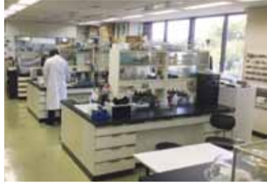
科学捜査研究所の様子

令和の時代の犯罪対策の鍵は科学捜査であると考えます。科学捜査研究所は機材の増加に伴ってスペースが手狭になり、執務室を実験室に転用するなどして対応してきましたが、鑑定の効率性や安全性の面から限界を迎えています。そこで、できるだけ早期に別庁舎に移せないかと考えており、来年度予算で調査費を要求しているところです。