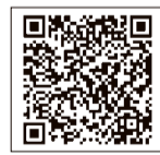
議長定例記者会見