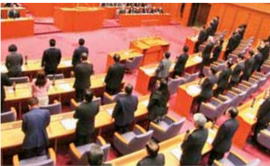
本会議（11月20日）での採決の様子

新型コロナウイルス感染症のまん延などにより、委員会に出席することが困難となった議員が、オンラインで委員会に出席できるように「三重県議会委員会条例の一部を改正する条例案」が議員提出議案として提出され、11月20日に本会議で可決されました。