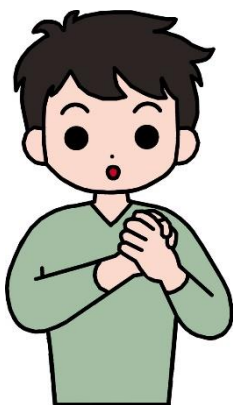
なかま 仲間・友だち