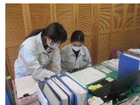
女性現場監督による女性現場事務スタッフへの研修