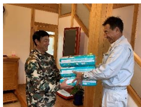
育児休業者へプレゼント