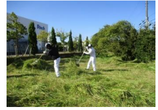
緑地整備活動を14年間実施