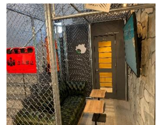
作業やWEB会議に集中 できる 「60分集中Room」