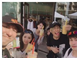
プチコミファミリー制度での海外旅行