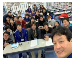
社長自ら講演する次世代養成塾