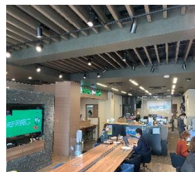
フリーアドレスのオフィス 効率改善のアイデアと 遊び心が詰まっている