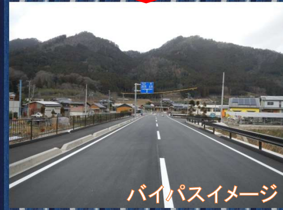
バイパスイメージ