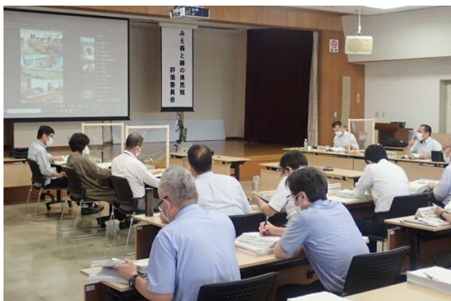
みえ森と緑の県民税評価委員会の開催状況

また、みえ森と緑の県民税の用途や事業成果等について、各種媒体を活用した広報活動を行います。