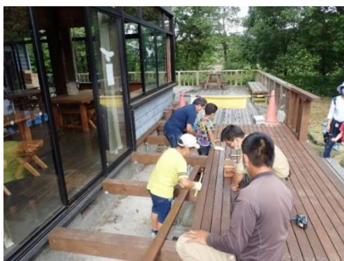
森林教育イベント

また、そのフィールドとなる自然公園の園地や自然歩道等において、活用される施設の安全確認・点検を行い、安全・安心に利用できるようにサイン標識や説明看板の設置、歩道の階段や転落防止柵等の改修などを行います。