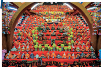
阿下喜のおひなさん