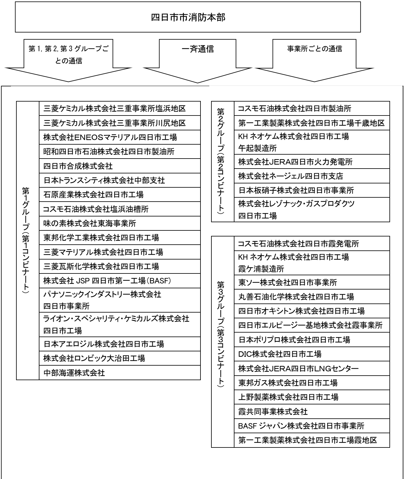
四日市臨海地区 MCA 無線系統図