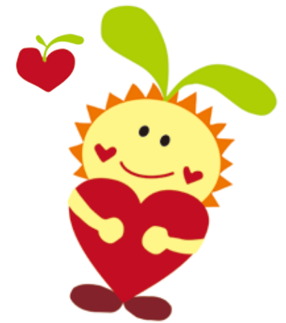
みえさとちゃん (三重県里親啓発公認キャラクター)

様々な事情で自分の家庭で暮らせない子どもたちを家庭に迎え入れ、養育を行う方を「里親」といいます。