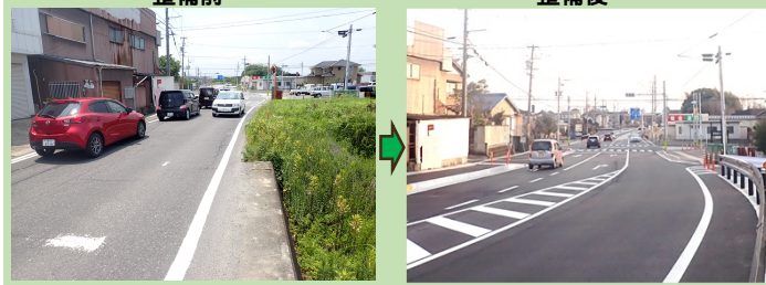
整備前 藤ヶ丘交差点の渋滞状況 整備後

幅員狭小区間を拡幅することで国道165号から国道23号へのアクセス機能が向上し、また、主要渋滞箇所である藤ヶ丘交差点の渋滞緩和が見込まれます。