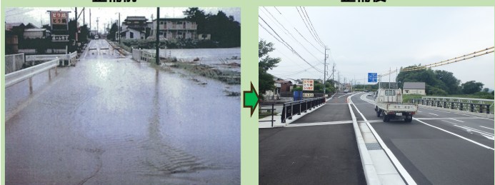
整備前 冠水箇所 整備後

豪雨の際に冠水していた箇所について、路面の嵩上げや道路側溝の整備を行うなどの冠水対策を実施しました。