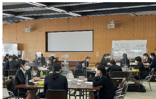
職歴や役職に応じ、多様なテーマのキャリア開発研修を実施。