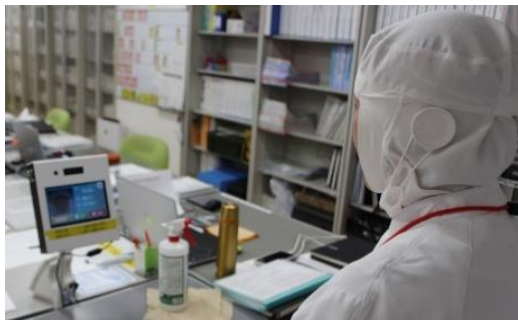
DXプロジェクト (顔認証システム導入)

○DXプロジェクトとして、テーマごとに3つの業務改善チームを立ち上げた。各チームが中心となり、情報のクラウド化や働き方改革に取り組んでいる。