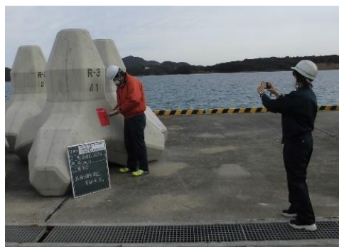
建設部門で女性技術職が活躍