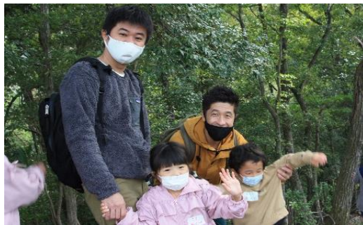
アズキキングの森 (親子環境学習イベント)