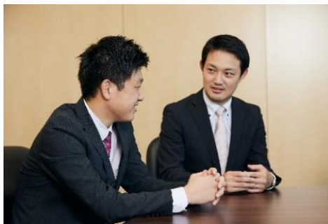
1on1ミーティングをはじめとしたコミュニケーションに注力。