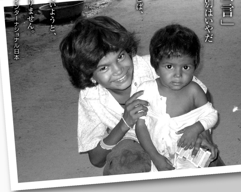
アムネスティ・インターナショナル日本

「世界人権宣言」 第二条 差別はいやだ わたしたちはみな、 意見の違いや、生まれ、 男、女、宗教、人種、ことば、 皮膚の色の違いによつて 差別されるべきでは ありません。 また、どんな国に生きていようと、 その権利にかわりはありません。