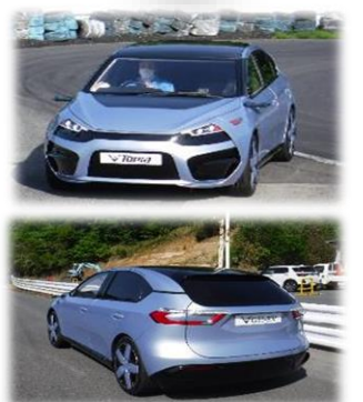
自社オリジナルコンセプトカー