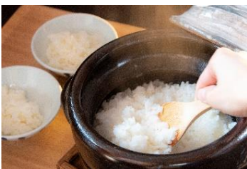
↑ 部屋食で提供している伊賀米

全てのお部屋からオーシャンビューを楽しむことができる高台のリゾートホテルです。バイキングと部屋食の両方において県産米を使用しており、中でも露天風呂付特別室の部屋