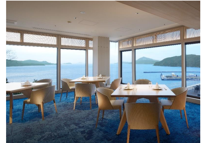
大きな窓から海に浮かぶ鳥羽の島々が一望できる