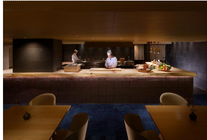
ヒノキのカウンター下は、四日市の万古タイルを使用