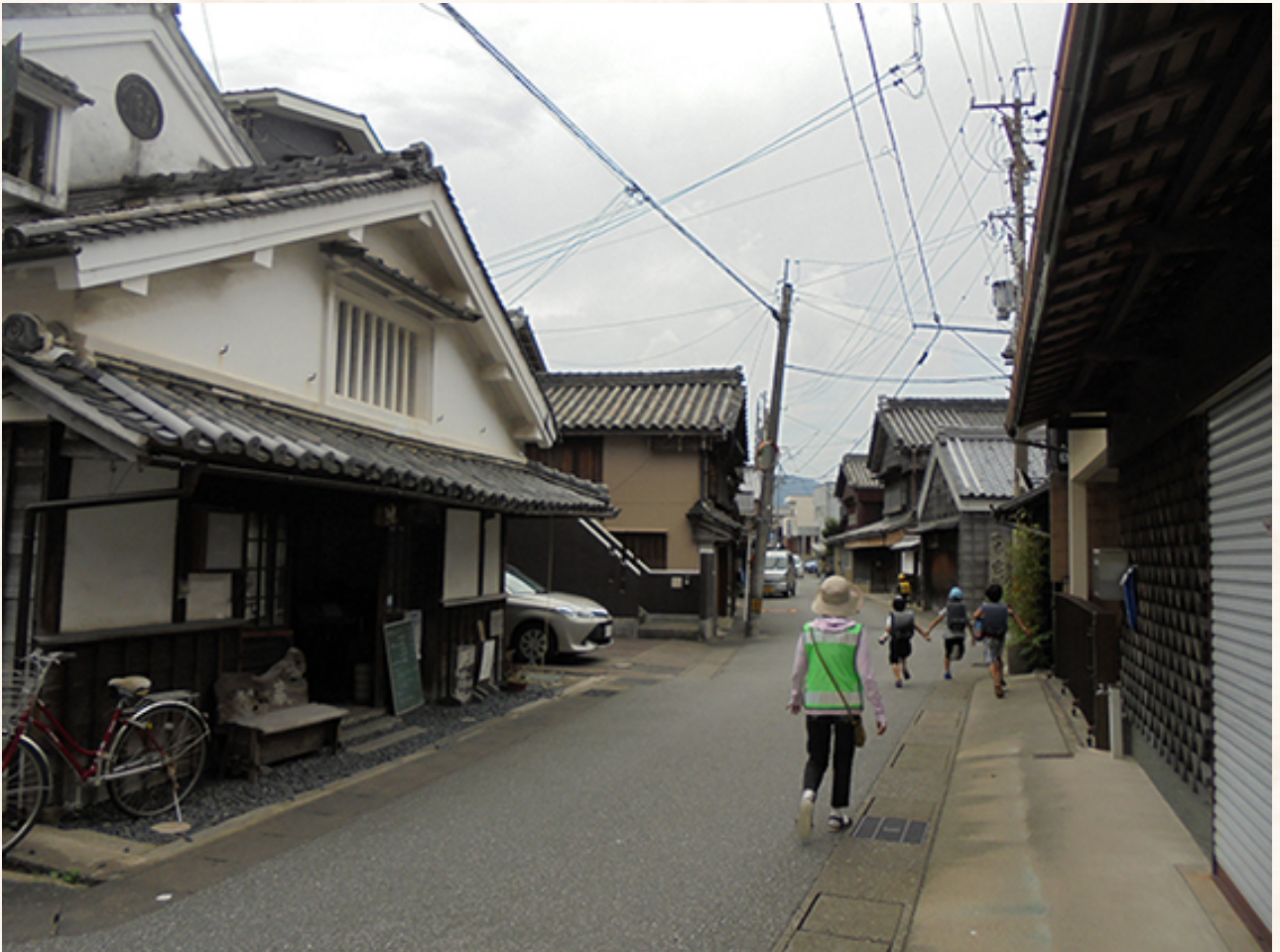
昔の町並みと、人びとの暮らしが融合するまち河崎。