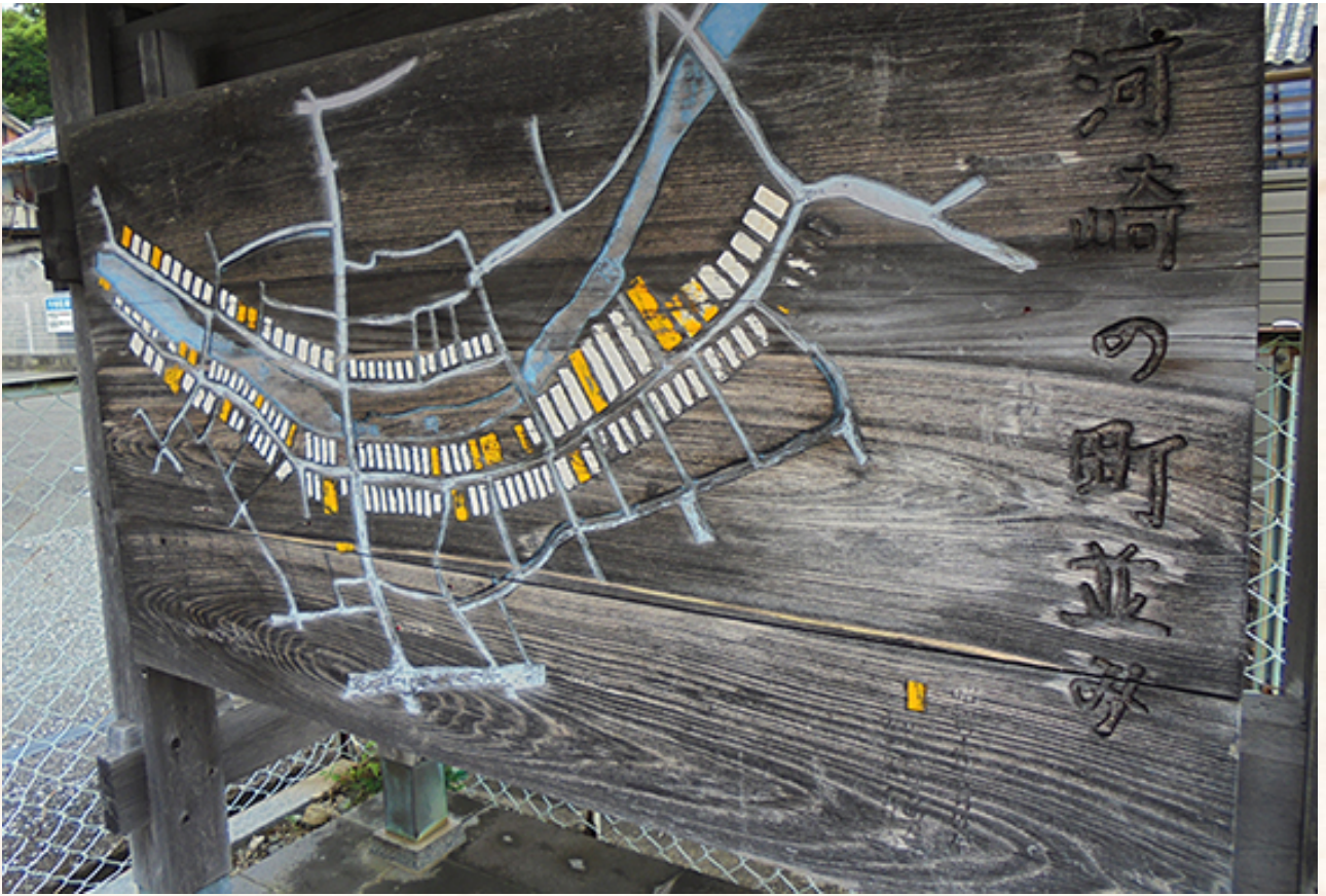
イベントの舞台は伊勢河崎の町並みです。