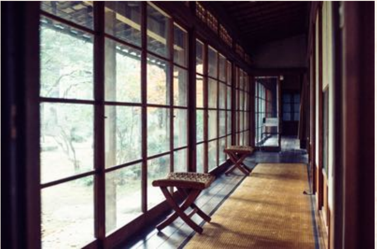
国登録文化財に指定されている土井見世邸は、昭和初期建築の和風モダニズム設計。