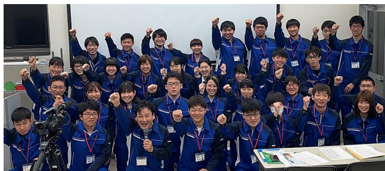
多くの若手社員が活躍中