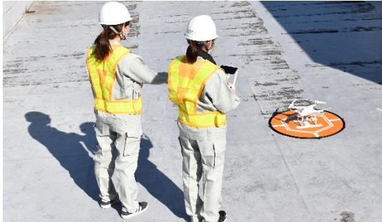
ICT測量機器の導入により 業務効率化の実現