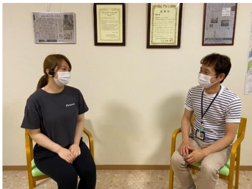
キャリアコンサルティングの実施により、相談しやすい職場環境