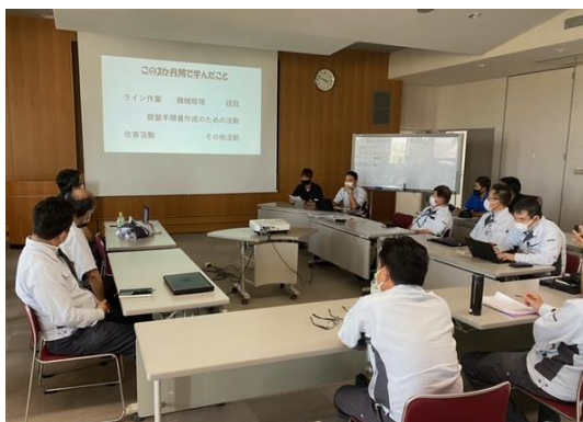
新入社員と指導員による相互研修会を実施

○従業員自らが講師となる個人スキル向上勉強会を開催することで、リスキングの機会や、従業員の説明力向上につながっている。