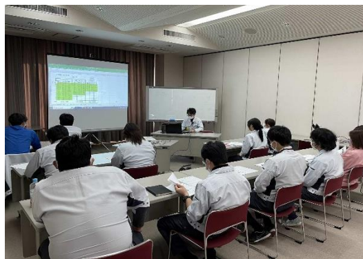
従業員自らが講師となって説明する、個人スキル向上勉強会の開催