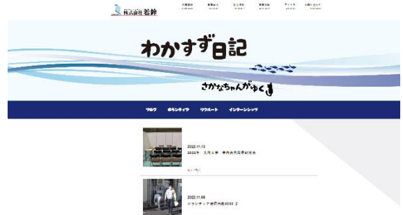
自社制作ホームページにて 社内の取組等を情報発信