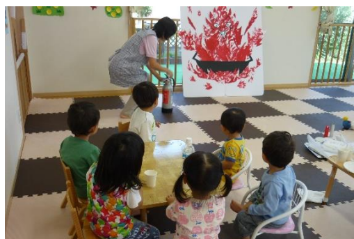
企業内託児所「アイアイキッズルーム」