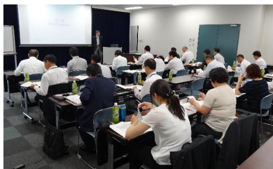
社内研修会の様子