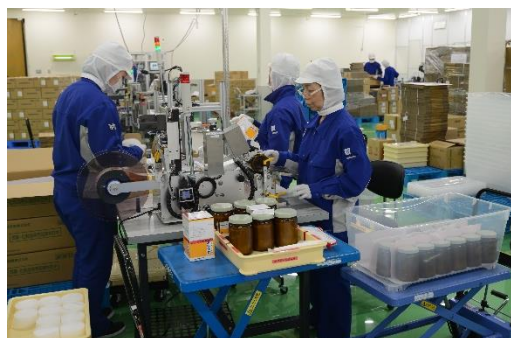
ジョブローテーションによる多能工化