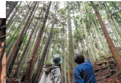
製作場所近くの森林は、地元の山主さんにより大切に育てられてきた。森林のことを深く知るための林道散策ツアーガイド付きプランも

五感で木に触れて楽しむ ツール製作プログラム 三重県産の木材を使用する家具製作所、同社が運営する人気のキャンプ場「かぶとの森テラス」の奥に続く森林の散策と、ヒノキや杉を使った本格的なスツール等、木工製品を製作するプログラム。木々に囲まれた屋外の製作場所、まずカット済みの材料を紙やすりで磨き、蜜ろうワックスを塗って天板を仕上げる。続くアイアンの脚を取り付ける工程では、スタンプからドライバーの使用方法についてレクチャーがあるため、初心者でも納得の仕上がりに。スツール（1万4000円）のほかに、お箸（1300円）や杉のブックススタンドの製作（1900円）も。子どもたちをはじめ、すべての人々が木に触れ合うことで学びを得る「木育」体験をぜひ。