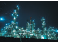
四日市市の夜景コンビナート

人口は県内最大。四日市コンビナートの夜景は撮影スポットとして有名。町なかを走る四日市あすなろう鉄道、名物の四日市とんてきもお忘れなく。