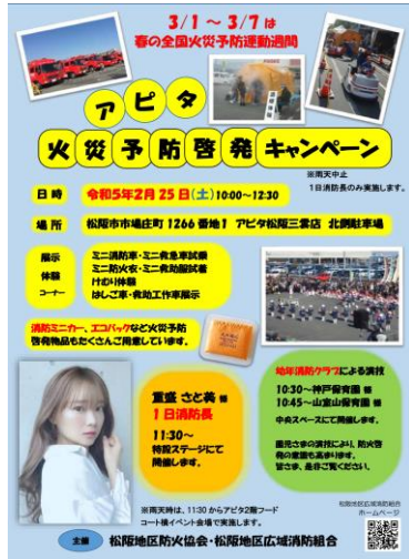
キャンペーンチラシ