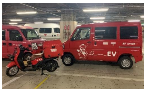
(郵便局が保有する車両)