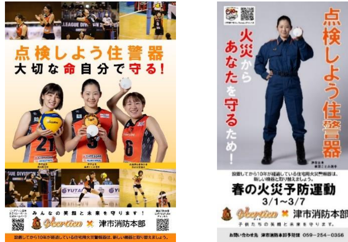
住宅用火災警報器普及啓発用ポスター

ポスターはヴィアティン三重女子バレーボールチームに所属する選手を起用しています。