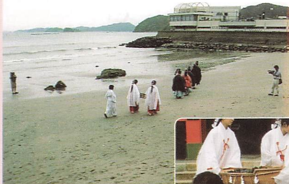
大綿津見命に神饌を送り出す前の浜