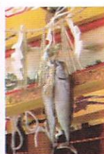
【写真1-2】 かけの魚部分