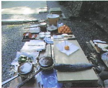
板の上の式の準備物