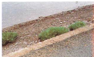
マツナ(立神漁協付近)