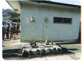
ヤオヤオの終着点