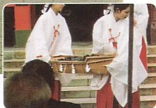
神饌を載せた木船