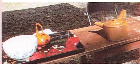
【写真4】御神酒と甘酒