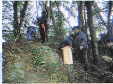
御札・芋がしらの納めどころ。 この向こうが宮川である