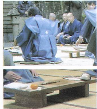
板の上の式の始まり