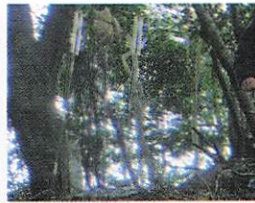
お札・芋がしらを納めた様子