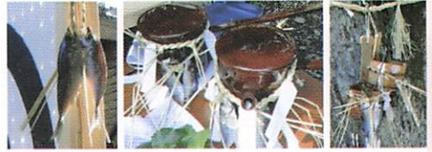
的・長柄の銚子・水桶に付けられたかけの魚