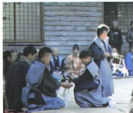
八幡宮の式の様子