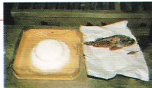
南島町方座浦おこせ祭りの餅とおこせ