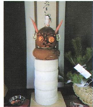
【写真3】大餅、鬼頭、俵に刺した松