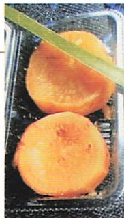
城田神社の大根炊き