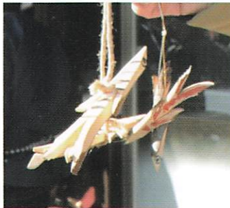
【写真2】ツバメのつかい