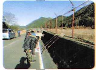
2回目の礼拝場所と様子