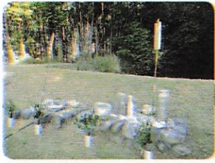
ヤオヤオの出発点