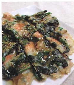
【写真3】黒にんにくのチヂミ