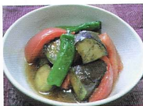
茄子とトマトの旨煮