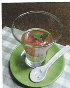
丸ごとトマトゼリー