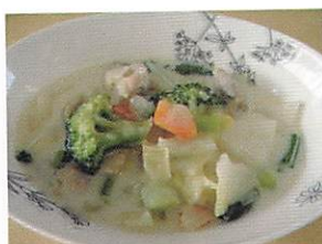
ヘルシーボカボカ米粉シチュー