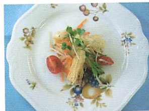
じゃがいものバリバリサラダ