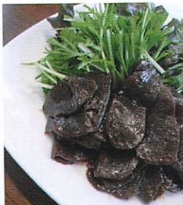
【写真2】黒にんにく焼肉風