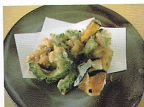
豚こまと野菜のつまみ揚げ