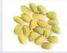
あくねもち 熟しても玄米に緑色が残るモチ性の緑米。収穫が遅れると緑が薄れる。