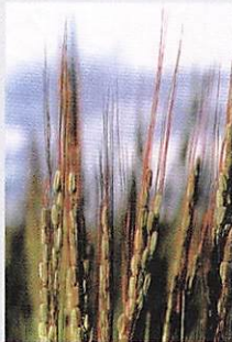
岡山県総社の赤米(国司神社神饌米)