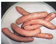
玉城豚加工品「ペールラオフ」