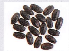
朝紫 インドネシアのバリ島在来黒米から育成されたモチ性の黒米。