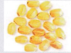
ヒエリ 高知県の在来種から選抜された香り米。大粒で強い香りをもつ。