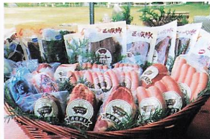
玉城豚加工品のいろいろ