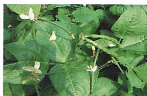
【写真1】白みとり豆の莢と花