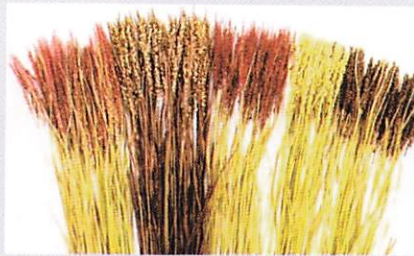
【図7】江戸時代の赤米や在来の変ったイネ

ドライフラワー 左からつくし赤もち、紫 丹、神丹穂、シガハネ ゴメ、あくねもち。早刈 り・クエン酸処理で発 色をよくしている。