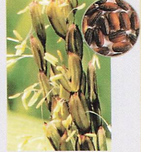
中国の黒米 黒米は中国やインドネシアでは古くからつくられてきたが、日本に在来品種はない。写真：中国在来の黒選5号。円内：上海紅血糯。