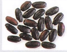
おくのむらさき インドネシアのバリ島在来黒米から育成されたウルチ性の黒米。