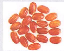
ベニロマン 対馬赤米から改良育成されたウルチ性の赤米。