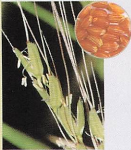
総社赤米 岡山県総社市の国司神社の神田に古くから伝わるピンクの長いノギをもつ赤米。