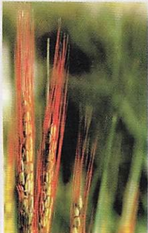
長崎県対馬の赤米(多久頭魂神社神饌米)