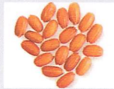
つくし赤もち 対馬赤米から改良育成されたモチ性の赤米。加工用や生け花に利用。