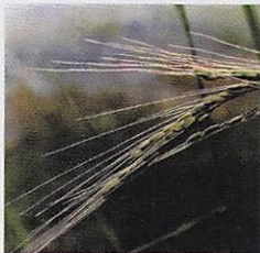
鹿児島県種子島の赤米(宝満神社神饌米)