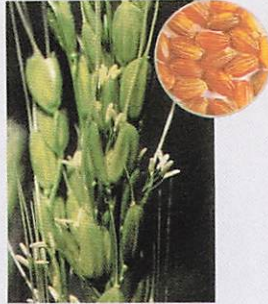
種子島赤米 種子島の宝満神社の神饌田に伝わる程が長く、白く長いノギをもつ赤米。