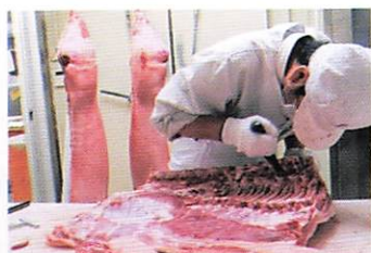
丁寧に解体されているところ