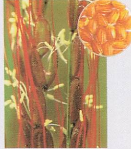
対馬赤米 対馬の多久頭魂神社のご神体として伝わる赤く長いノギをもつ赤米。