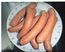
玉城豚加工品「クラカウアー」