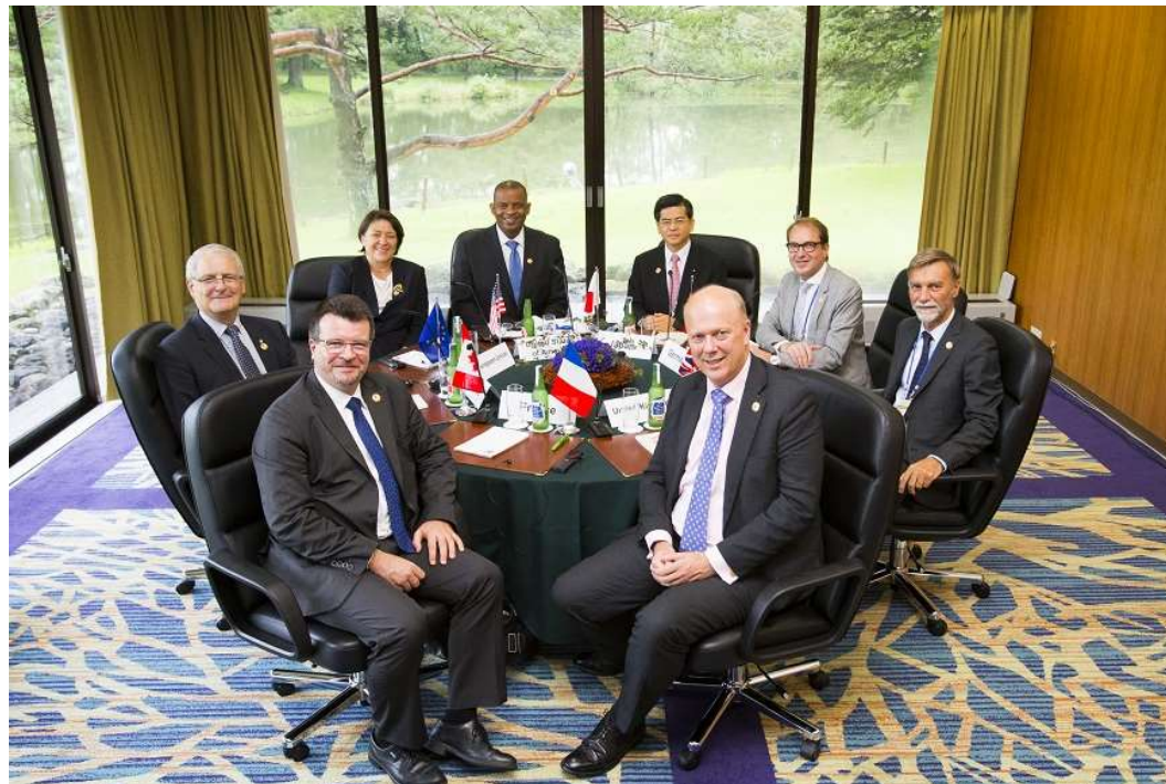
2016年の大臣会合の様子（国土交通省HPより引用）

G7交通大臣会合とは、G7交通担当大臣及びEUの交通担当委員が一堂に会し、交通の今後、ひいては社会全体を左右する重要なテーマを取り上げ、大きな方向性を議論するもの。