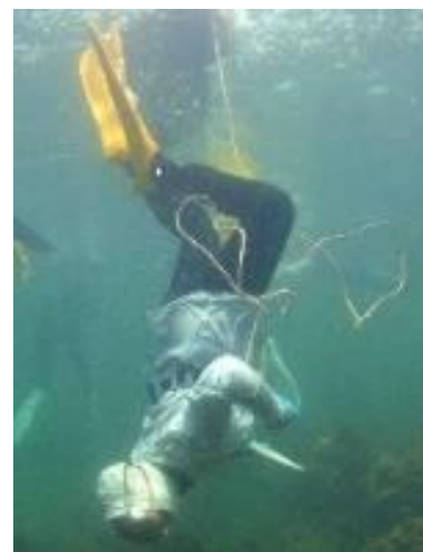
伊勢志摩（イメージ）