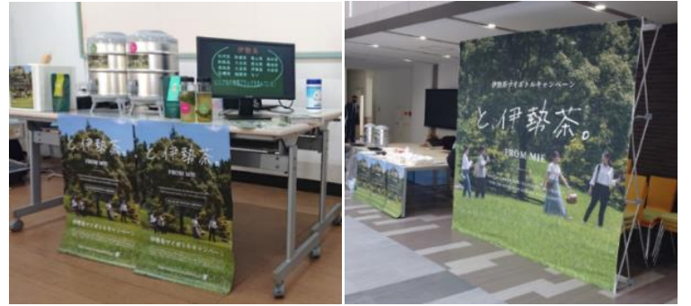
伊勢茶ブース（イメージ）