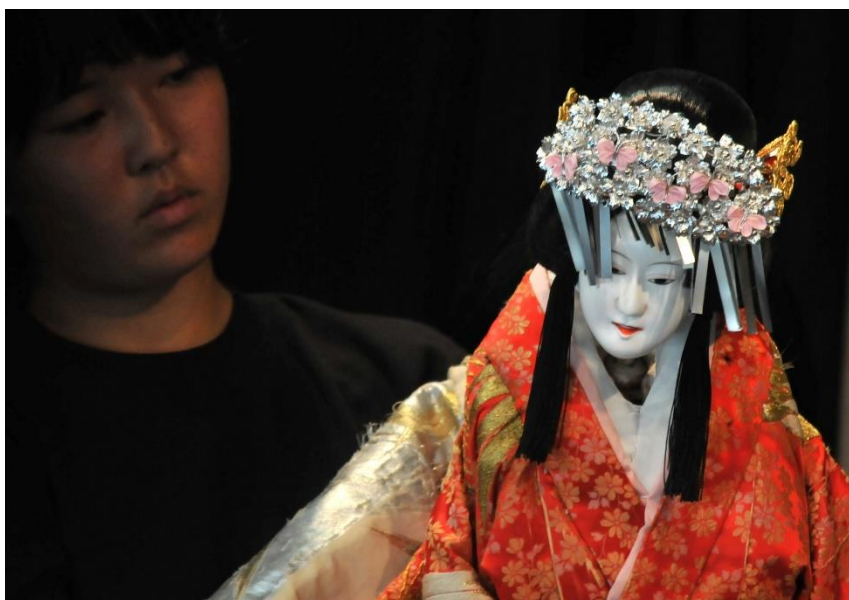
安乗の人形芝居(志摩市立東海中学校)