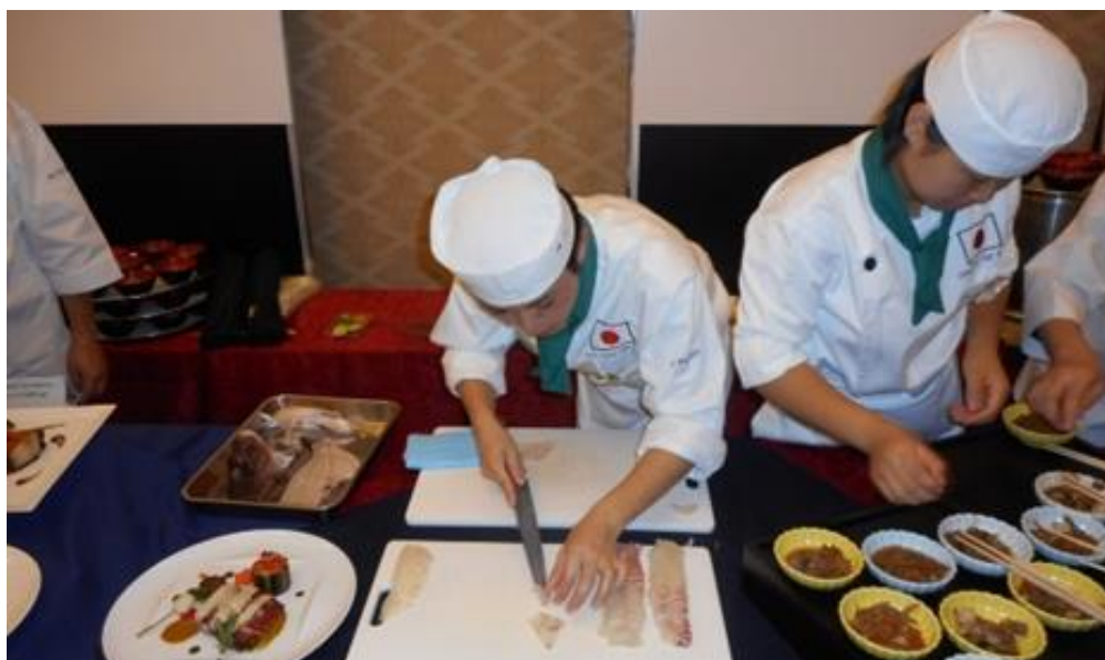
高校生によるライブ料理(相可高校)

メニュー(予定) ・だし巻き玉子 ・握り寿司 (伊勢まだい、伊勢まぐろ、松阪牛)