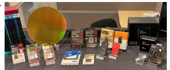
フラッシュメモリー など半導体製品