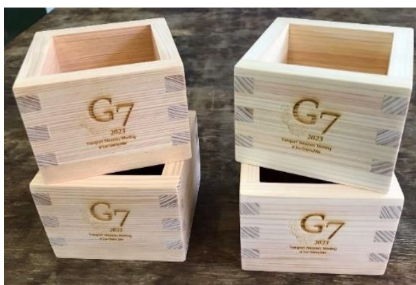
④四日市中央工業高校・四日市工業高校