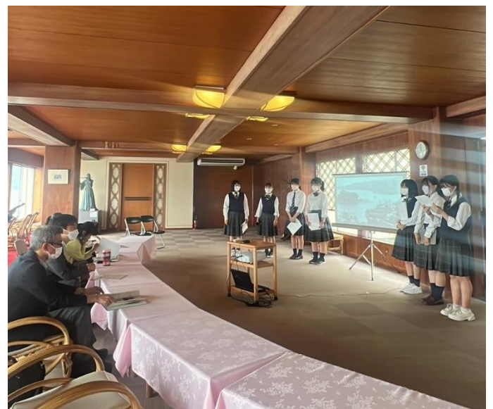
⑥外国語案内ボランティア (研修の様子)