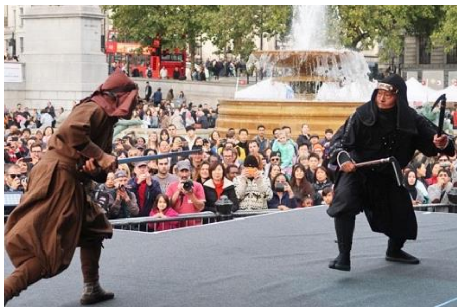
忍術実演(伊賀忍者特殊軍団 阿修羅)