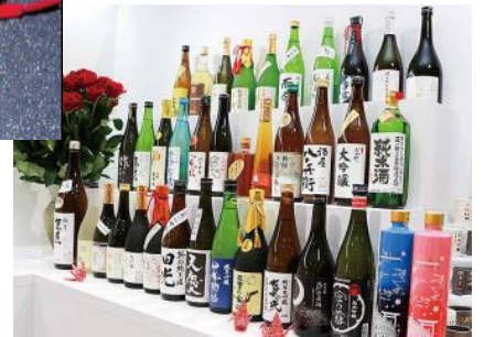
三重県産の日本酒 （イメージ）