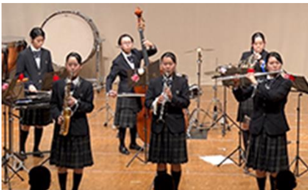
①白子高校