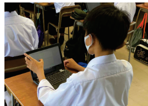
<端末を使用した個別学習>