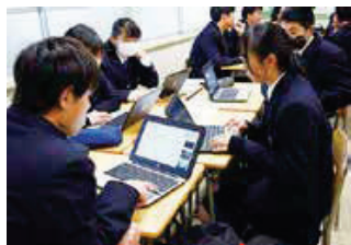
<グループでの共同編集>

また、海外姉妹校とのオンライン交流や各種講演会など、グローバルな視野を身に付ける学習活動にも取り組んでいます。