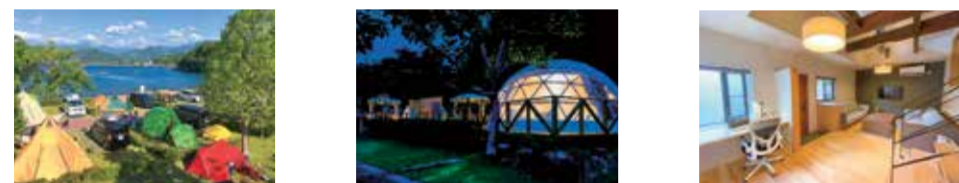
屋外Wi-Fi完備のオートキャンプ場 東紀州地域初のグランピング施設 ワーケーション環境の整ったコテージ