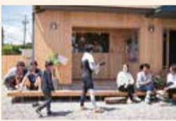
仕事に疲れたら、思い思いに好きなことでリフレッシュ

センターの活動とは別に、社会貢献したい企業などから寄付金を集め、若者が技術やアイデアで社会問題を解決するプロジェクトに利用できるNPOを立ち上げています。また、空き家の持ち主と、空き家を求める若者とのマッチングサイトも運営する予定です。若者が「チャレンジしたい」ってなった時に、それが面白い企画だったら運営に必要な資金が提供できるし、空き家の紹介もできるという仕組みです。これからは、子どもたちが自分の地域の魅力を知る取り組みもしていきたいです。「どうして志摩にいるの」って聞かれた時に「海がすごくきれいで、この環境を守りたいから」みたいに、ここで暮らす理由をそれぞれに語れる未来をつくりたいですね。