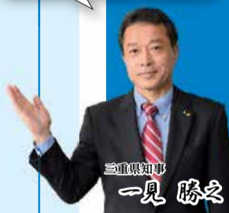
三重県知事 一見 勝之

県では2050年までに温室効果ガス排出実質ゼロをめざしています。子どもたちの未来のため、できることから取り組みましょう！