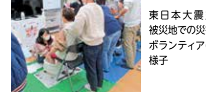
東日本大震災被災地での災害ボランティアの様子