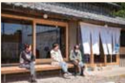
地元の人たちとの交流も「CO Blue Center」の魅力