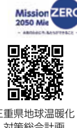
三重県地球温暖化対策総合計画

国連の気候変動に関する政府間パネル (IPCC) の報告書では、「人間の影響が大気、海洋及び陸域を温暖化させてきたことには疑う余地がない」とされています。地球規模で気温は上昇し続けており、今後、これまでに集中豪雨や熱中症、農水産物への被害が増加することなどが考えられます。県では「三重県地球温暖化対策総合計画」を令和5年3月に改定し、「県民一人ひとりが脱炭素に向けて行動する持続可能な社会」を実現するために、さまざまな取り組みを進めています。