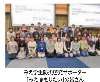
みえ学生防災啓発サポーター「みえ まもりたい」の皆さん