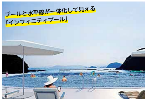
プールと水平線が一体化して見える「インフィニティプール」 (イメージ図) プールから熊野灘の雄大な景色を堪能 (イメージ図)