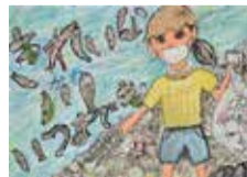
令和4年度入賞作品

問い合わせ先 県土整備部 河川課 TEL 059・224・2686 FAX 059・224・2684 E kasen@pref.mie.lg.jp