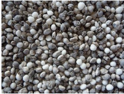
図 1 葉ネギ用指定混合肥料