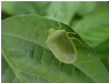
ミナミアオカメムシ