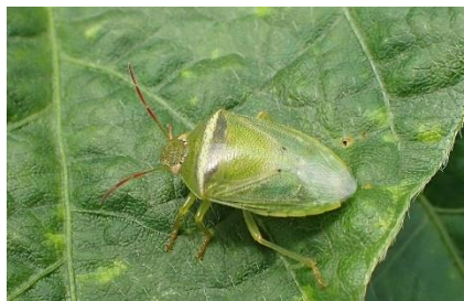
イチモンジカメムシ