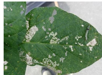
ハスモンヨトウによって白く変色した葉

○ハスモンヨトウは大豆の葉の表皮を食害するため、被害を受けた 葉は白く 変色します(白変葉)。また、老齢になる(大きくなる)にしたがって薬剤の効果が低下します。白変葉が生じたら幼虫が大きくなる前に防除しましょう。ハスモンヨトウは 8 月下旬ごろから急増するので、防除適期は 8 月中旬から 9 月中旬 ごろになります。