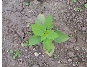
フウリンホオズキ (ホオズキ類)

○雑草が大きくなると、薬剤が効きにくくなります。 雑草が小さいうちに 防除しましょう。