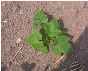
マルバアサガオ (帰化アサガオ類)