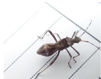
ホソハリカメムシ

○子実被害を抑制するために、 莢伸長期(開花20日後) と 子実肥大期(開花 40 日後) の 2 回防除 に努めましょう。7月上中旬に播種したフクユタカの防除適期は 8月下旬から9月下旬 ごろです。