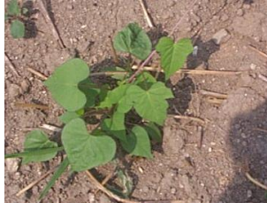
マメアサガオ (帰化アサガオ類)