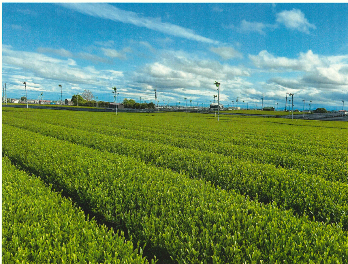
伊勢茶（四日市市水沢地区）